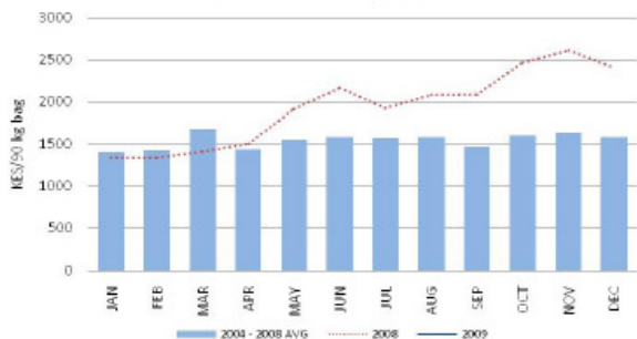
Fig. 2: Großmarktpreise für Mais in Nairobi