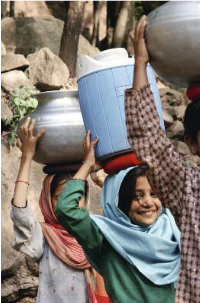
>> Nicht nur wie hier in Pakistan ist Wasserholen die Aufgabe von Frauen und Mädchen.