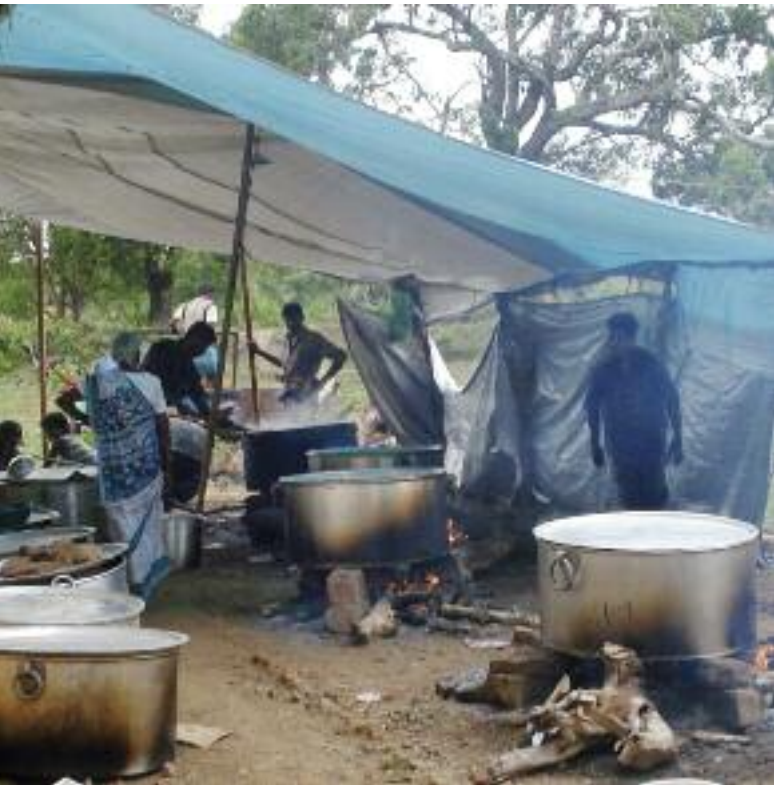
>> Aus riesigen Töpfen werden Tausende Menschen versorgt.

Der Gesundheitszustand der Menschen sei besorgniserregend gewesen, erzählt Altweck, viele waren verletzt und am Ende ihrer Kräfte. Es mangelte vor allem an Nahrung und frischem Wasser. Derzeit versorgt die Welthungerhilfe innerhalb der Lager die Flüchtlinge mit Lebensmitteln – gemeinsam mit Sewalanka und dem Welternährungsprogramm der Vereinten Nationen. Familien erhalten Pakete mit z. B. Kleidung, Moskitonetzen, Bettdecken, Tellern sowie Seife. Für Kleinkinder werden Windeln und kleine Moskitonetze, für ältere Menschen einfache Betten bereitgestellt.