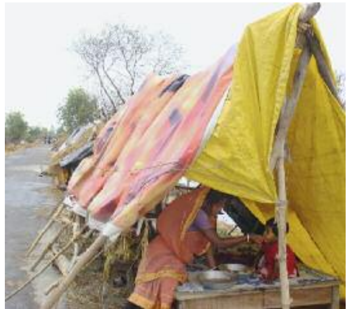
>> In provisorischen Unterkünften geht der Alltag weiter.