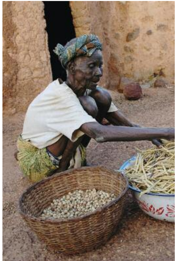
>> Karge Ernte: Kichererbsen und Wachsbohnen gehören zu den Grundnahrungsmitteln in Burkina Faso.