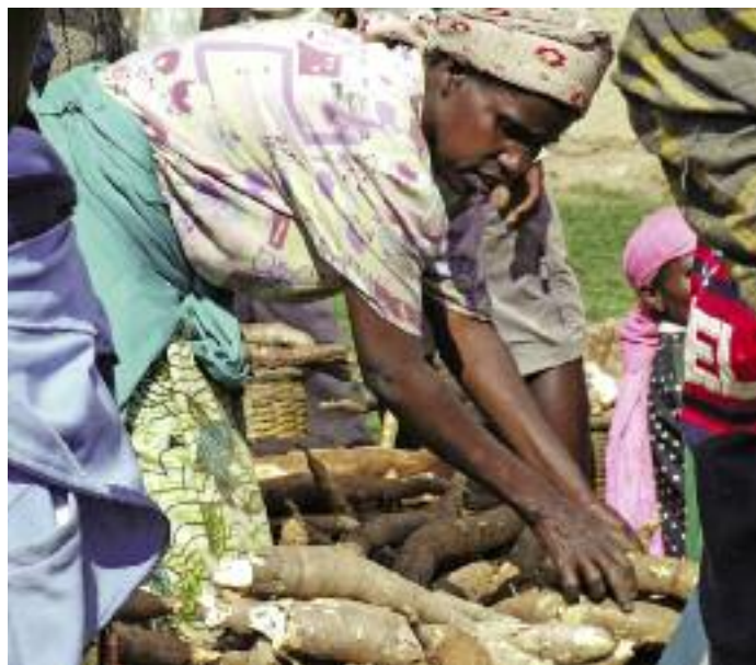
>> Auf dem Markt im Base-Kiryango Tal verkauft diese Frau Maniok.

Das Thema „Rolle der Geschlechter“ bestimmt ebenfalls die geplante politische Podiumsveranstaltung des Freundeskreises der Welthungerhilfe am 15. Oktober in Hamburg. Unter dem Titel „Die hungrige Milliarde – Perspektiven zur Überwindung des