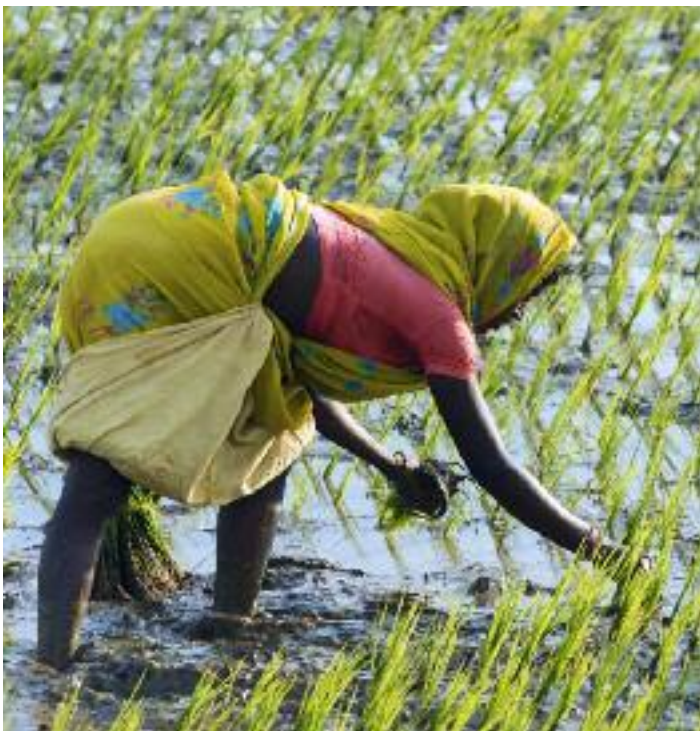
>> Nur zehn Prozent der Anbauflächen gehören Frauen.

In Kenia verbrennen Frauen beispielsweise bis zu 85 Prozent ihres täglichen Kalorienbedarfs allein beim Wasserholen für die Familie. Um diese festgefahrenen Strukturen zu ändern, brauchen Frauen einen zeitlichen Freiraum, um sich weiterzubilden und an Trainings teilzunehmen. Deshalb zielen die Projekte der Welthungerhilfe auf eine Erleichterung ihrer täglichen Arbeit und auf Förderung ab. Beispielsweise mit dem Bau von Brunnen, Schulen, Krediten an Frauen und Maßnahmen, um ihnen einen stärkeren Einfluss in der Dorfgemeinschaft zu gewähren.