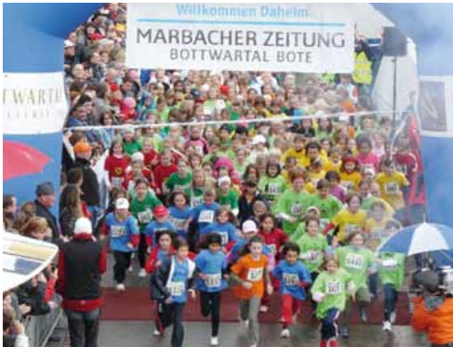
>> Wind und Regen konnte den Teilnehmern der LebensLäufe im Rahmen des Bottwartalmarathons nichts anhaben