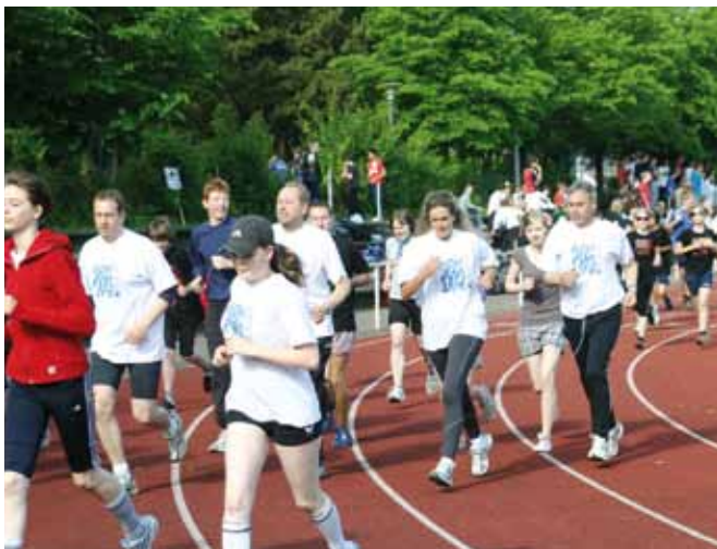
>> Mehr als 1.000 Läuferinnen und Läufer des Ernestinum-Gymnasiums legten sich für die Welthungerhilfe kräftig ins Zeug