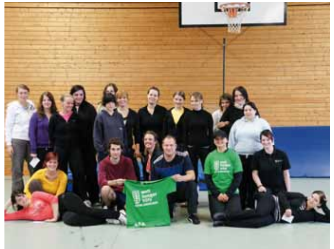
>> Die Schüler der Gesundheitsschule des Klinikums am Weissenhof engagierten sich im Rahmen der „Woche der Welthungerhilfe“