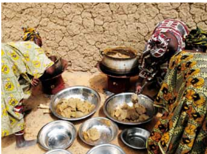
>> Das Essen für die Schulspeisung wird zubereitet

Schule gerne Lehrer, weil die Schüler sehr motiviert sind und Lesen und Schreiben lernen wollen. Sie wecken mich manchmal sehr früh auf, damit ich unterrichten komme. Manche Schüler sind da schon um 7 Uhr und warten auf den Unterricht.“