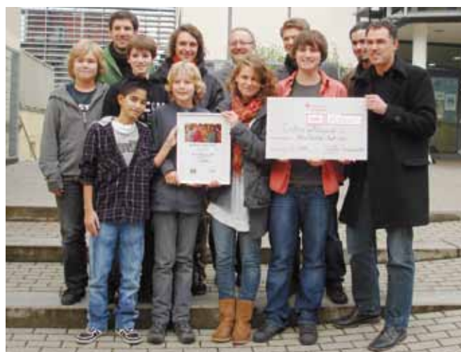
>> Stolze 15.812,49 Euro übergaben die SV-Vertreter des Schiller-Gymnasiums der Welthungerhilfe