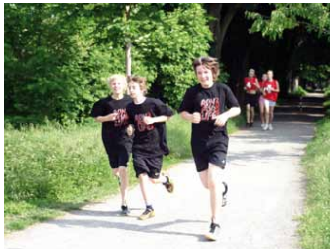
>> „Run for Life“ ist das Motto des Ernestinum-Gymnasiums in Celle