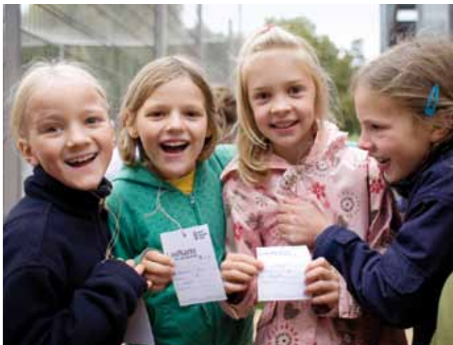
>> Großen Spaß hatten diese Schülerinnen der Evangelischen Schule Pankow bei ihrem Lauf