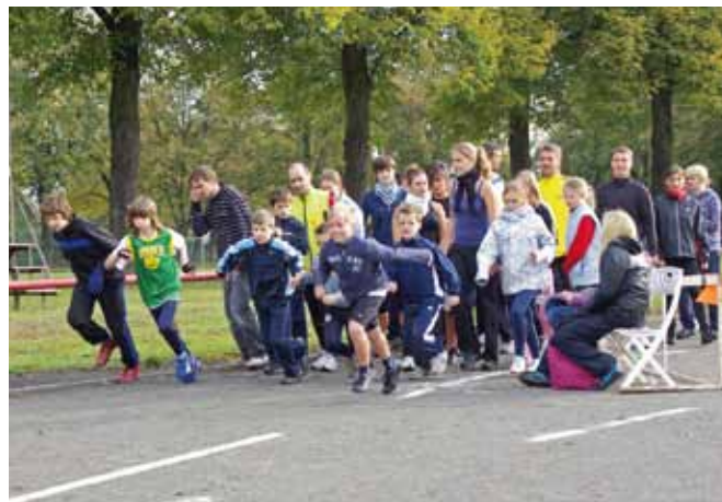
>> Von Anfang an bei der Aktion LebensLäufe dabei: Das Lise-Meitner-Gymnasium startete zum 13. Mal!

1.100 Läuferinnen und Läufern hatten sich manche schließlich vorgenommen, die Marathon-Marke zu knacken. Einige Schüler schafften tatsächlich die volle Distanz, drei Lehrerinnen und ein Lehrer kamen auf vierzig, ein Schülervater auf 33 Kilometer.