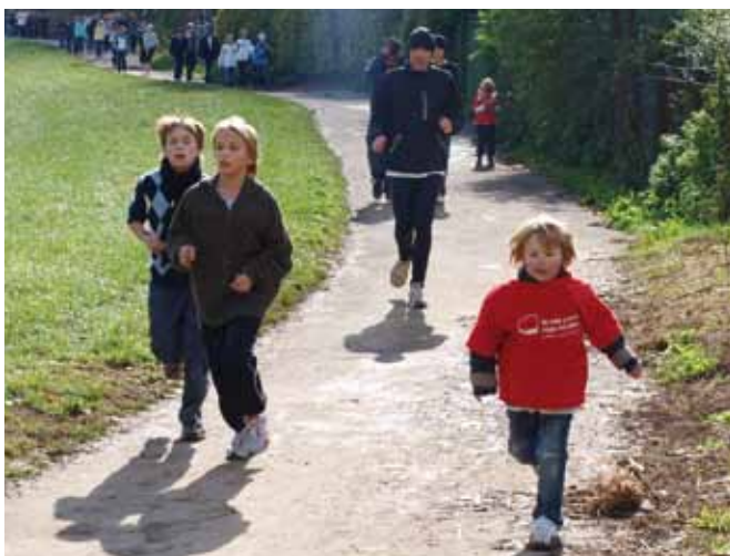
>> Sechs Schulen aus Stuttgart haben sich zusammengetan und einen großen Lauf mit insgesamt 1.600 Kindern auf die Beine gestellt