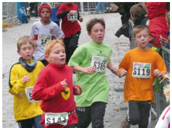
>> 850 Kinder beteiligten sich am Lauf im Bottwartal