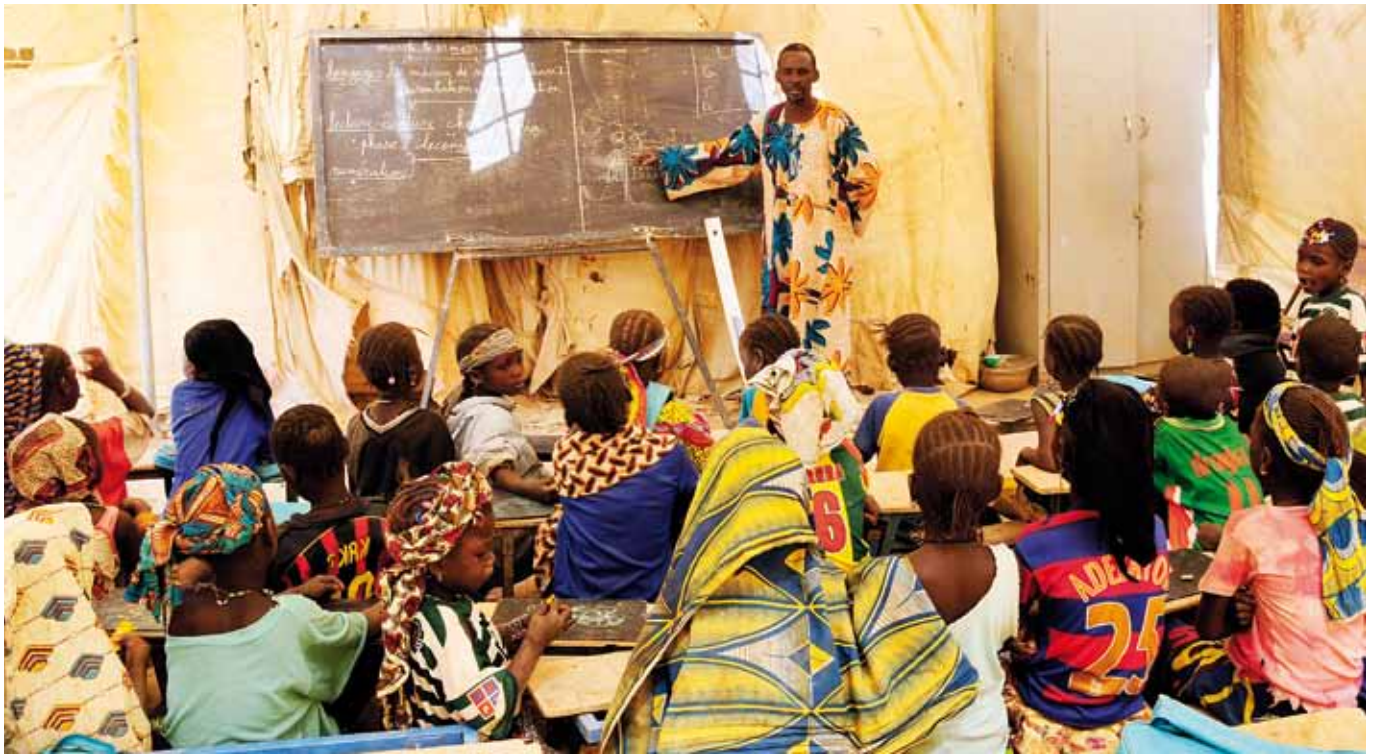
>> Die mobile Schule zieht mit den Nomaden durch Mali