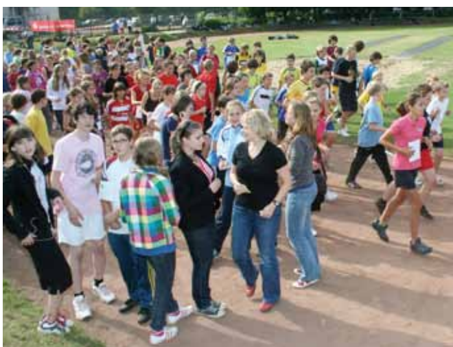
>> Lebenslauf, Spiele, Vorträge – die Organisation der Schülervertretung des Schiller-Gymnasiums Witten hat hervorragend funktioniert