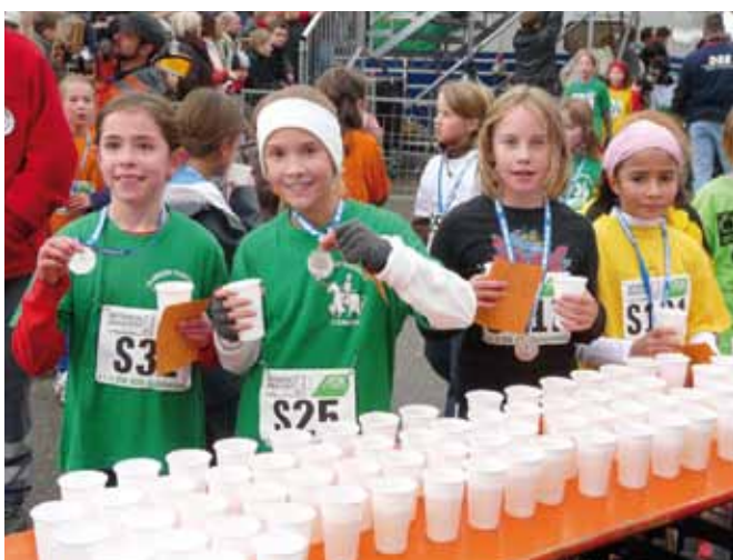
>> Stärkung nach dem Lauf durch das Bottwartal