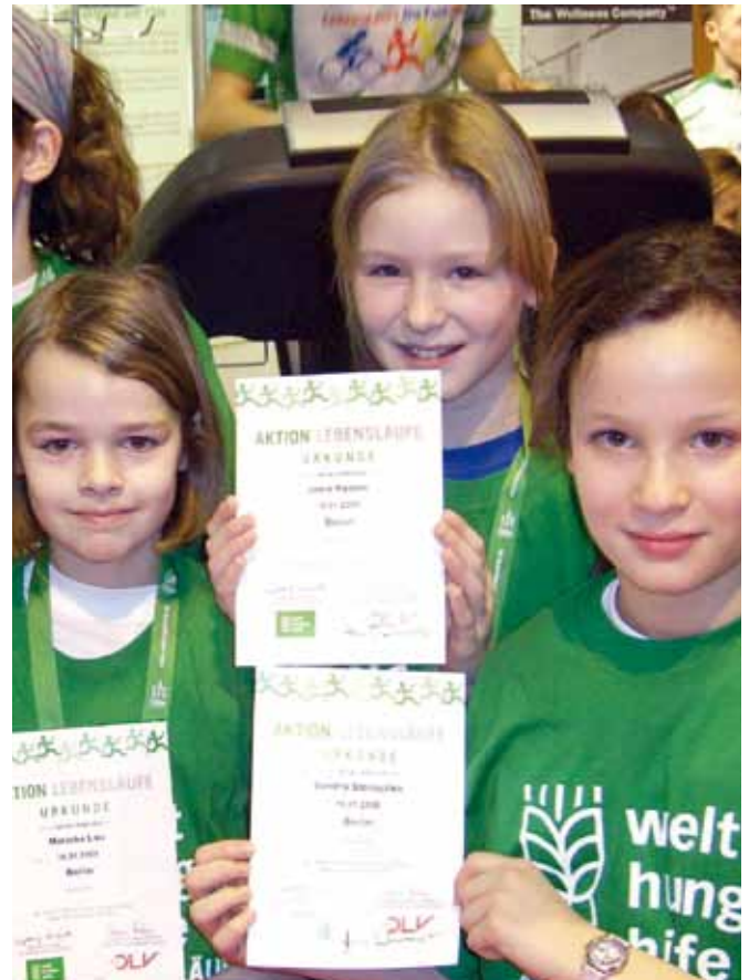
>> Stolz präsentieren die Kinder ihre Urkunden, die sie sich während der Grünen Woche am Stand der Welthungerhilfe erradelt haben

Gut, dass die Stadtwerke Niederkassel genug Wasser mitgebracht hatten, denn bei dem herrlichen Wetter an diesem 18. September wäre sonst der Durst zu groß geworden. Von den