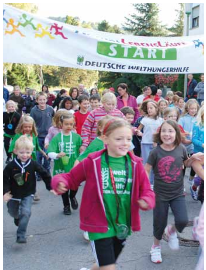
>> Berlin: Aktion LebensLäufe auf der Grünen Woche