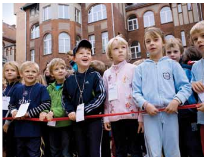
>> Die Schülerinnen und Schüler der Evangelischen Schule Pankow erliefen tolle 6.500 Euro für Mali