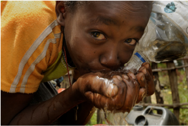
Wasser ist Leben – vor allem im trockenen Äthiopien. Trinkwasserbrunnen verringern Infektionskrankheiten und sorgen für eine höhere Lebensqualität.

Die Einwohner von Sodo haben in den vergangenen fünf Jahren ihre Dorfentwicklung vorangetrieben. Besonders stolz sind sie auf ihr neues Gemeinde- und Kulturzentrum, das sie gemeinsam mit der Welthungerhilfe und ihrer lokalen Partnerorganisation Community Development Service Association (CDSA) errichtet haben. In dem traditionellen Rundbau treffen sich die verschiedenen Bauern- und Frauengruppen sowie das Entwicklungskomitee. Der neu erstandene Ortskern besitzt mittlerweile auch einen Gesundheitsposten, eine Schule und eine Getreidebank - alles deutliche Anzeichen für den Aufschwung in Sodo. Da Wasser extrem knapp ist, haben die Welthungerhilfe und CDSA mehr als zehn Tiefbrunnen gebohrt (MDG 7). Die Einwohner haben dabei fest mit angepackt. Waschbecken, Duschkabinen und Latrinen wurden neben den Brunnen errichtet, wodurch sich die hygienischen Zustände erheblich verbessert haben. Krankheiten wie Durchfall oder Malaria sind deutlich zurückgegangen (MDG 4, 5, 6). Gegen Malaria wirkt auch die Heilpflanze Artemisia annua (eine Beifuß-Art), die inzwischen neben jeder Trinkwasserstelle und jeder Hütte wächst.