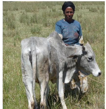
Borena-Rinder erleichtern die Landwirtschaft auf Sodos Feldern.

Ein großes Problem in Sodo war die schlechte Ernährungslage. Drei Viertel aller Menschen hatten nicht genug zu essen. Das sieht heute anders aus: Durch trockenheitsresistentes Saatgut und innovative Anbaumethoden sind Hunger und Armut deutlich zurückgegangen. Die Kleinbauern haben ertragreicheres Saatgut gepflanzt und die Vielfalt der Getreidesorten erweitert. Sie verwenden selbst hergestellten, organischen Dünger, pflanzen Obstbäume als Erosionsschutz und erhöhen