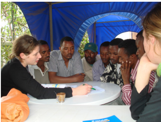
Was steckt hinter dem MDG-Monitoring? Information und Aufklärung spielen eine wichtige Rolle in dem Prozess.

Diesen positiven Trend bestätigen auch die jährlichen PIA-Workshops. Beim ersten Treffen legten die Teilnehmer pro Millenniumsziel jeweils drei konkrete Entwicklungsziele für ihre Dorfgemeinschaft fest, auf die sie sich bis 2010 konzentrieren wollten. Für das MDG 5 (Gesundheit der Mütter verbessern) waren dies beispielsweise: 1. funktionierende Familienplanung, 2. ausreichend Trinkwasser und 3. keine übermäßige Arbeitsbelastung der Frauen.