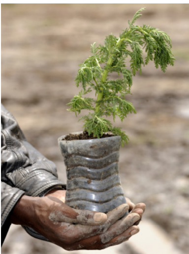
Als Tee zubereitet schützen die Blätter der Artemisia -Pflanze vor Malaria.

durch verbesserte Fruchtfolge und Mischkultur die Bodenqualität. Indem sie beispielsweise Mais und Bohnen zusammen kultivieren, steigen die Erträge beachtlich. Überschüsse werden im nahegelegenen Ort Tulu Bolo verkauft. Auf den Böden von Sodo wächst heute eine Vielfalt an Produkten wie Sesam, Karotten, Mangold, Rote Beete, Kohl, Avocado oder Mango. Durch die vitaminreiche Nahrung leiden immer weniger Menschen an Fehl- und Mangelernährung (MDG 1). Zwei Getreidebänke sorgen für die richtige Lagerung, gute Verkaufserlöse und ausreichend Saat für die kommende Saison. Zur besseren Grundversorgung haben Welthungerhilfe und CDSA höherwertiges Milchvieh, Borena-Rinder, Zuchtbulln, Geflügel und Ziegen eingeführt. Und sie schulen die Bauern regelmäßig in Tierhaltung, Futteranbau und Wiederaufforstung.