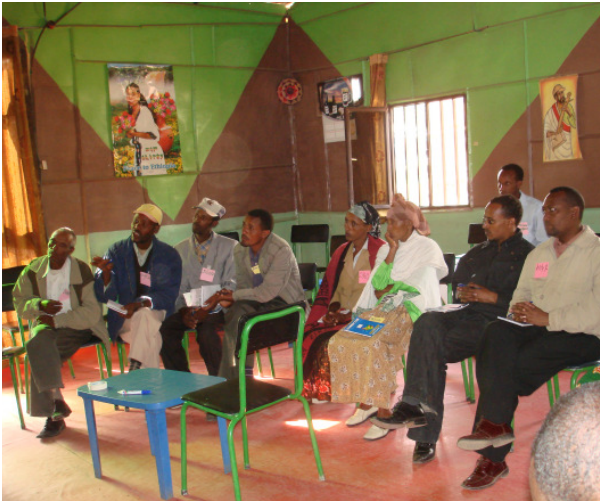
Fortbildungen und PIA-Workshops stärken die Selbsthilfekräfte der Bevölkerung.

Wichtigste Voraussetzung für eine nachhaltige Entwicklung ist die Beteiligung der Bevölkerung. Die Welthungerhilfe versetzt die Menschen vor Ort in die Lage, sich selbst zu organisieren, die Situation im Dorf zu analysieren und realistische Lösungsansätze zu entwickeln. Dazu gehört auch die kritische Überprüfung der Aktivitäten. Im Rahmen der Millenniumsinitiative hat die Welthungerhilfe ein effektives und wirkungsorientiertes Monitoring-System entwickelt, das die Bevölkerung bewusst von Anfang an mit einbezieht.