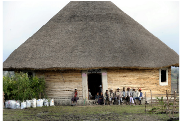
Das neue Dorfgemeinschaftszentrum ist Dreh- und Angelpunkt der erstarnten Gemeinde.

Das Dorf Sodo ist eine Streusiedlung und liegt 100 Kilometer westlich der äthiopischen Hauptstadt Addis Abeba. Es gehört zu einem von 15 Dörfern oder Regionen in Asien, Afrika und Lateinamerika, die die Welthungerhilfe im Jahr 2005 als Millenniumsdörfer ausgewählt hat. Zu Beginn der Initiative beschlossen die Bewohner jedes Dorfes, bis zum Jahr 2010 mindestens eines oder mehrere Millenniumsziele (Millennium Development Goals / MDG) aktiv umzusetzen. Die Prioritäten legten sie dabei selber fest. Fachliche und finanzielle Unterstützung nach dem Prinzip Hilfe zur Selbsthilfe erhielten die Menschen von der Welthungerhilfe. Nach fünf Jahren Projektarbeit wird jetzt Bilanz gezogen. Um die Ergebnisse in den einzelnen Millenniumsdörfern zu messen, hat die Welthungerhilfe ein umfangreiches Monitoring-System entwickelt, das nun ausgewertet worden ist.