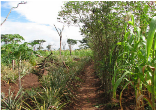
Die jungen Ananaspflanzen werden durch Mais und Hecken vor Wind und Regen geschützt.

In Mangué muss niemand mehr hungern. Das Dorf hat sich in den vergangenen fünf Jahren enorm entwickelt. Die Welthungerhilfe hat die Bauern mit hochwertigem Saatgut sowie Schulungen für einen effektiven Anbau bei der Steigerung des Ernteertrages unterstützt (MDG 1). Die Bewohner haben Bewässerungssysteme angelegt und nutzen natürliche Pflanzenschutzmittel und Dünger auf ihren Feldern. Hecken und Obstbaumreihen schützen vor Erosion und erhöhen gleichzeitig die Bodenfruchtbarkeit (MDG 1, 7). Zugtiergespanne erleichtern die Arbeit, die vermehrte Tierhaltung (Hühner, Enten, Ziegen, Schafe, Schweine und Rinder) erhöht die Proteinzufuhr der Menschen und steigert ihre Einkommen. Um ihre Produkte besser vermarkten zu können, hat die Bevölkerung in Gemeinschaftsarbeit Brücken und Straßen repariert.