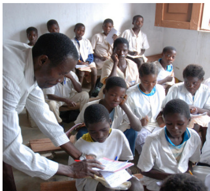
Der Anteil der Mädchen in den Klassen liegt bei 50 %

Der Neubau einer Schule und die Renovierung eines weiteren Schulgebäudes sind abgeschlossen (MDG 2). Jetzt können 520 statt 160 Kinder am Unterricht teilnehmen. Viel mehr Mädchen sind unter den Schülern: Heute sind es 50 Prozent, zuvor besuchte nur ein Fünftel von ihnen die Schule (MDG 2, 3). Auch Erwachsene nutzen die Möglichkeit, Abendkurse zu besuchen, darunter zunehmend Frauen (MDG 3). Ein Elternrat setzt sich für die Belange der Schülerinnen und Schüler ein und trifft sich bei Bedarf mit den Lehrern - ein weiteres Zeichen dafür, dass die Menschen in Mangué immer mehr Verantwortung übernehmen und ihr Dorfleben aktiv mitgestalten.