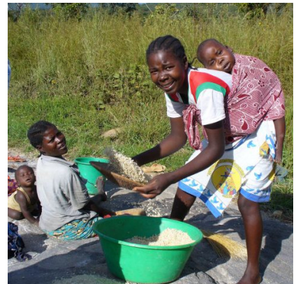
Gesundheits- und Ernährungsberatung wird in Mangué Leben retten.

Mit der Renovierung und Ausstattung des örtlichen Gesundheitspostens sowie der Ausbildung traditioneller Hebammen hat sich die medizinische Versorgung in Mangué entscheidend verbessert. Der Weg zum nächstgelegenen Gesundheitsposten in 45 Kilometern Entfernung entfällt. Ein Solarpanel liefert die notwendige Energie für die Kühlung der Impfstoffe und Medikamente. Neue Trinkwassersysteme tragen zur deutlichen Abnahme der Durchfallerkrankungen bei. Auch Informationskampagnen zu den Themen HIV/AIDS, Hygiene und Ernährung sowie die Einführung der Artemisia-Pflanze (Beifuß) zur Bekämpfung von Malaria sind Schritte auf dem Weg in eine bessere Zukunft. Eine Frauenkochgruppe beschäftigt sich intensiv mit gesunder Ernährung für sich und ihre Kinder (MDG 4, 5, 6). Der Bau von Latrinen und Müllgruben nimmt ebenfalls zu, aber die Bevölkerung muss sich noch an die für sie ungewohnten Hygienemaßnahmen gewöhnen (MDG 7).