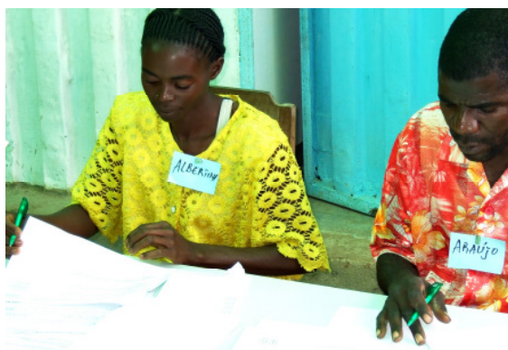
Fragen muss gelernt sein: Interviewer werden für die Datenerhebung des Haushaltsfragebogens geschult.

Diesen positiven Trend bestätigen auch die jährlichen PIA-Workshops. Beim ersten Treffen legten die Teilnehmer pro Millenniumsziel jeweils drei konkrete Entwicklungsziele für ihre Dorfgemeinschaft fest, Pro Millenniumsziel definierten sie drei konkrete Entwicklungsziele, auf die sie sich bis Ende 2010 konzentrieren wollten. Für das MDG 3 (Gleichstellung der Frauen) waren diese beispielsweise: 1. Frauen nehmen am sozialen Leben teil, 2. gegenseitige Hilfe von Männern und Frauen und 3. Eltern schicken ihre Kinder – Jungen wie Mädchen – in die Schule.