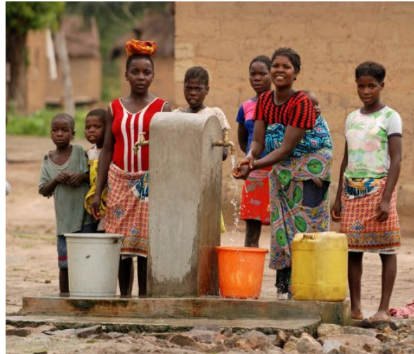
Der neue Dorfbrunnen erleichtert den Arbeitsalltag der Frauen in Mangue.

Mangue ist ein kleines Bauerndorf auf dem Hochplateau im Westen von Angola. Es gehört zu einem von 15 Dörfern oder Regionen in Asien, Afrika und Lateinamerika, die die Welthungerhilfe im Jahr 2005 als Millenniumsdörfer ausgewählt hat. Zu Beginn der Initiative beschlossen die Bewohner jedes Dorfes, bis zum Jahr 2010 mindestens eines oder mehrere Millenniumsziele (Millennium Development Goals / MDG) aktiv umzusetzen. Die Prioritäten legten sie dabei selber fest. Fachliche und finanzielle Unterstützung nach dem Prinzip Hilfe zur Selbsthilfe erhielten die Menschen von der Welthungerhilfe. Nach fünf Jahren Projektarbeit wird jetzt Bilanz gezogen. Um die Ergebnisse in den einzelnen Millenniumsdörfern zu messen, hat die Welthungerhilfe ein umfangreiches Monitoring-System entwickelt, das nun ausgewertet worden ist.