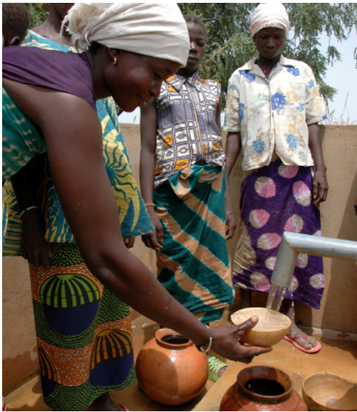
Frauen schöpfen Wasser aus dem neuen Brunnen in Boalin.

Seitdem in Kongoussi Trinkwasser fließt, hat sich das Leben erheblich verbessert. Durch den Bau von Brunnen müssen die Frauen nicht länger halbstündige Märsche zum See zurücklegen. Jetzt können sie bequemer und häufiger sauberes Wasser in ihrer Nähe zapfen. Damit das kostbare Lebensmittel auch in Zukunft ausreicht, haben die Einwohner Komitees gegründet, die sich um Wasserentnahme, Pflege und Wartung der Brunnen kümmern. Durchfall und Infektionskrankheiten sind dadurch bereits zurückgegangen (MDG 4, 5, 6, 7).