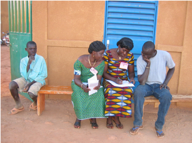
Fragen will gelernt sein. Interviewer werden für die Datenerhebung des Haushaltsfragebogens geschult.

Wichtigste Voraussetzung für eine nachhaltige Entwicklung ist die Beteiligung der Bevölkerung. Die Welthungerhilfe versetzt die Menschen vor Ort in die Lage, sich selbst zu organisieren, die Situation im Dorf zu analysieren und realistische Lösungsansätze zu entwickeln. Dazu gehört auch die kritische Überprüfung der Aktivitäten. Im Rahmen der Millenniumsinitiative hat die Welthungerhilfe ein effektives und wirkungsorientiertes Monitoring-System entwickelt, das die Bevölkerung bewusst von Anfang an mit einbezieht.