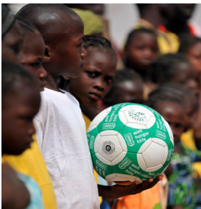
Sport ist ein Anreiz für die Kinder, zur Schule zu gehen.

Um mehr Beschäftigungsmöglichkeiten vor Ort zu schaffen, haben die Dorfbewohner neue Geschäftsideen entwickelt. Kleinhandel, Getreideverarbeitung wie zum Beispiel die Herstellung von Hirsebier, Kleinviehproduktion und -handel sowie der Verkauf von Schweinen und Ziegen gewährleisten ihnen zunehmend gesicherte Einkommen. Alphabetisierungskurse sind ebenfalls wichtig für das Gewerbe und Frauengruppen werden mit Kleinkrediten und speziellen Kursen besonders gefördert (MDG 3). Seit kurzem gibt es in allen vier Dörfern eine Schule mit Brunnen und Pumpen, Latrinen und einer Küche. Das Unterrichtsmaterial ist kostenfrei. Um den Eltern die Bedeutung von Bildung bewusst zu machen, führen die Welthungerhilfe und ihre Partnerorganisation gemeinsam mit der Provinzdirektion Kampagnen zu Bildung, Sport und Kultur durch (MDG 2) – mit Erfolg: Immer mehr Eltern schicken ihre Mädchen und Jungen in die Grundschule.