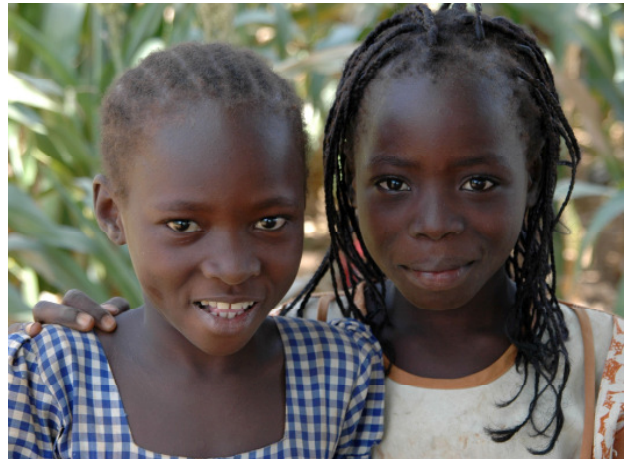
Die Mädchen von Kongoussi hoffen auf eine bessere Zukunft durch Bildung und neue Arbeitsmöglichkeiten.

Die vier Siedlungen des westafrikanischen Millenniumsdorfes liegen nahe der Stadt Kongoussi im Norden von Burkina Faso. Sie gehören zu einem von 15 Dörfern oder Regionen in Asien, Afrika und Lateinamerika, die die Welthungerhilfe im Jahr 2005 als Millenniumsdörfer ausgewählt hat. Zu Beginn der Initiative beschlossen die Bewohner jedes Dorfes, bis zum Jahr 2010 mindestens eines oder mehrere Millenniumsziele (Millennium Development Goals / MDG) aktiv umzusetzen. Die Prioritäten legten sie dabei selber fest. Fachliche und finanzielle Unterstützung nach dem Prinzip Hilfe zur Selbsthilfe erhielten die Menschen von der Welthungerhilfe. Nach fünf Jahren Projektarbeit wird jetzt Bilanz gezogen. Um die Ergebnisse in den einzelnen Millenniumsdörfern zu messen, hat die Welthungerhilfe ein umfangreiches Monitoring-System entwickelt, das nun ausgewertet worden ist.