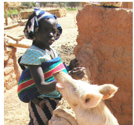
Schweinemast und Kleintierhaltung sind neue Einkommensquellen.

Die größten Herausforderungen in Kongoussi sind Erosion und abnehmende Bodenfruchtbarkeit (MDG 1, 7). Deshalb haben die Welthungerhilfe und AZND breit angelegte Informationskampagnen gestartet. Schon in der Schule lernen die Kinder das Wichtigste zum Thema Umwelt- und Bodenschutz und wie sie die Fruchtbarkeit der Äcker fördern können. In der Praxis schützen die Bauern ihre Felder mit Steinwällen und neu gepflanzten Nutz- und Obstbäumen. Mit der bewährten Zaï-Methode erhöhen sie die Fruchtbarkeit ihrer Äcker: Sie graben Löcher (Zaï) und füllen diese mit Kompost. Termiten, Würmer, Bakterien und Mikroorganismen zersetzen die organischen Materialien nach dem ersten Regen im Boden und lockern diesen insgesamt auf. Die Nährstoffe stehen damit den Pflanzen zur Verfügung. Mit dem nächsten Regen dringt Wasser ein und bereitet das Bett für neue Pflanzen. Organischen Dünger produzieren inzwischen fast alle Dorfbewohner selbst und sie kochen immer häufiger auf brennstoffsparenden Öfen. Die Menschen sind sich bewusst geworden, wie kostbar Wald und Umwelt für sie und ihre Kinder sind.