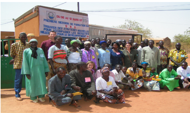
Der erste Workshop war für die Bewohner von Kongoussi noch ungewohnt, inzwischen haben sie die Vorteile der Teilhabe am Entwicklungsprozess schätzen gelernt.

Diesen positiven Trend bestätigen auch die jährlichen PIA-Workshops. Beim ersten Treffen legten die Teilnehmer pro Millenniumsziel jeweils drei konkrete Entwicklungsziele für ihre Dorfgemeinschaft fest, auf die sie sich bis 2010 konzentrieren wollten. Für das MDG 7 (ökologische Nachhaltigkeit) waren dies beispielsweise: 1. Bewusstseinswandel zugunsten des Waldschutzes, 2. erhöhtes Umweltbewusstsein und 3. Aufforstung.