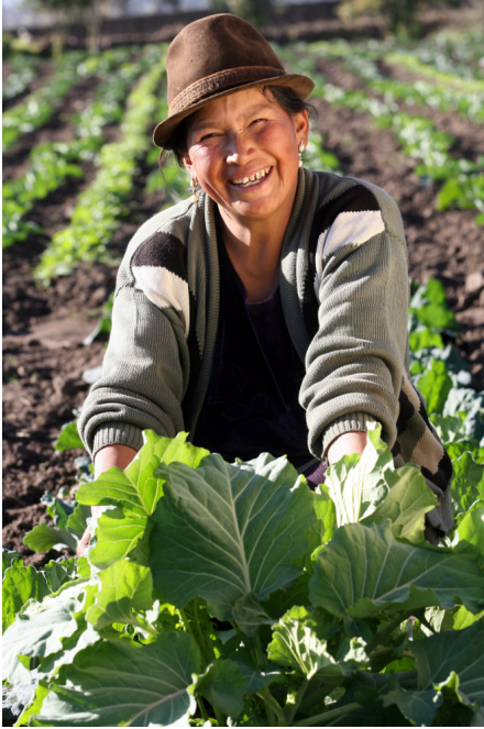
Dank Wasser und organischem Dünger erzielen die Dorfbewohner eine reiche Ernte mit Kohl, Gemüse und Obst

Die Menschen von San Andrés haben Hunger und Mangelernährung überwunden. Schon vor Projektbeginn hatten sie in Eigeninitiative erste Bewässerungskanäle gegraben, doch die Unterstützung der Welthungerhilfe und ihrer lokalen Partnerorganisation Central Ecuatoriana de Servicios Agrícolas (CESA) wirkte wie ein Katalysator: Mit großem Einsatz bauten die indigenen Bauern ein weitreichendes System von Kanälen, Verteilerwerken und Rohrleitungen auf. Heute ist der Hauptkanal betoniert, mehr als 30 Reservoirs speichern das Wasser oberhalb der Gemeinde und ein ausgefeilter Wasser-Nutzungsplan garantiert eine gerechte Verteilung. Die Dorfbewohner gründeten Bewässerungskomitees, die für Instandhaltung und Wasserentnahme zuständig sind. Jede Familie zahlt ein kleines Entgelt. Ein Dachverband vertritt die einzelnen Komitees des Millenniumsdorfes, um mit den Behörden und dem Betreiber des höher gelegenen Wasserkraftwerks besser verhandeln zu können.