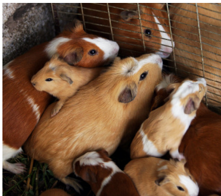
Meerschweinchen und Milchvieh sorgen für ein zusätzliches Einkommen.

Der Aufschwung ermöglicht immer mehr Männern, im Dorf zu bleiben und in der Landwirtschaft zu arbeiten. Sie schätzen inzwischen die Rolle und Leistung ihrer Frauen. Diese wiederum haben durch das bessere Bewässerungssystem deutlich weniger Arbeit und sie sind weniger Gefahren ausgesetzt, weil sie nachts nicht mehr auf die Felder zum Bewässern müssen. Früher mussten sie dabei sexuelle Belästigungen bis hin zu Vergewaltigungen fürchten. Eltern haben den Wert einer guten Bildung erkannt und machen nicht länger Unterschiede bei ihren Kindern: Immer mehr Mädchen besuchen jetzt eine weiterführende Schule (MDG 2, 3).