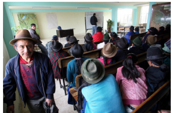
Teilhabe muss gelernt sein: In zahlreichen Workshops erwerben die Dorfbewohner Fähigkeiten, sich einzubringen und Verantwortung zu übernehmen.

Zufrieden („gut“) zeigten sich die Teilnehmer mit den Ergebnissen im Kampf gegen Armut: Mit dem Ausbau des Bewässerungssystems konnten sie ihre Erträge deutlich steigern, in landwirtschaftlichen Schulungen haben sie sich notwendiges Fachwissen angeeignet und sie nahmen an verschiedenen Austauschbesuchen in ganz Ecuador teil. Dadurch hat sich die Vielfalt ihrer Erzeugnisse erhöht und die Einkommen sind gestiegen. Ihre Zukunft sehen die Kleinbauern in Beregnungsanlagen. Bisher werden nur 10 Prozent aller Felder beregnet. So lautete das Fazit des letzten Workshops: „Das gesamte Projektgebiet benötigt eine technisierte Bewässerung, ein Plan wird erarbeitet.“ Der Zugang zu Wasser wird also weiterhin die entscheidende Rolle bei der Entwicklung des Millenniumsdorfes spielen.