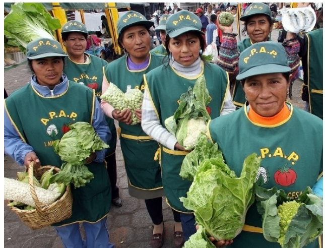
Gemeinsam stark: Die Bäuerinnen vermarkten ihre Produkte genossenschaftlich auf regionalen Märkten und in der Hauptstadt.

San Andrés liegt im kargen und extrem trockenen Hochland der ecuadorianischen Anden. Es gehört zu einem von 15 Dörfern oder Regionen in Asien, Afrika und Lateinamerika, die die Welthungerhilfe im Jahr 2005 als Millenniumsdörfer ausgewählt hat. Zu Beginn der Initiative beschlossen die Bewohner jedes Dorfes, bis zum Jahr 2010 mindestens eines oder mehrere Millenniumsziele (Millennium Development Goals / MDG) aktiv umzusetzen. Die Prioritäten legten sie dabei selber fest. Fachliche und finanzielle Unterstützung nach dem Prinzip Hilfe zur Selbsthilfe erhielten die Menschen von der Welthungerhilfe. Nach fünf Jahren Projektarbeit wird jetzt Bilanz gezogen. Um die Ergebnisse in den einzelnen Millenniumsdörfern zu messen, hat die Welthungerhilfe ein umfangreiches Monitoring-System entwickelt, das nun ausgewertet worden ist.