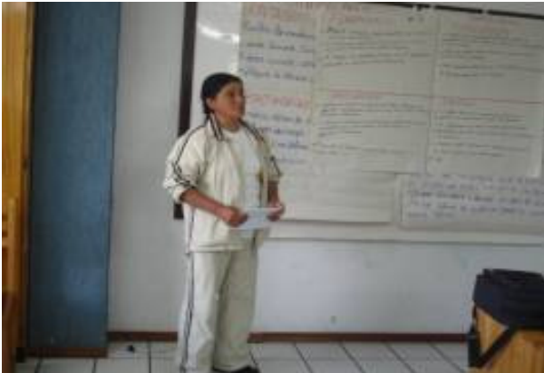
Beim PIA-Workshop wenden die Teilnehmer die Millenniumsziele auf ihre Situation vor Ort an.

Wichtigste Voraussetzung für eine nachhaltige Entwicklung ist die Beteiligung der Bevölkerung. Die Welthungerhilfe versetzt die Menschen vor Ort in die Lage, sich selbst zu organisieren, die Situation im Dorf zu analysieren und realistische Lösungsansätze zu entwickeln. Dazu gehört auch die kritische Überprüfung der Aktivitäten. Im Rahmen der Millenniumsinitiative hat die Welthungerhilfe ein effektives und wirkungsorientiertes Monitoring-System entwickelt, das die Bevölkerung bewusst von Anfang an mit einbezieht.