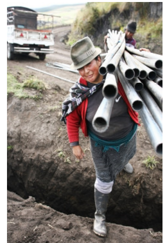
Rohrleitungen verhindern die Verdunstung

Neue Einkommensmöglichkeiten bietet die Tierhaltung. Neben Rindern und Milchvieh halten die Dorfbewohner vor allem Meerschweinchen. Die Nagetiere gelten in den Anden als proteinhaltige Delikatesse und sind in jedem Restaurant erhältlich. Die Welthungerhilfe und CESA vermitteln den Bauern das notwendige Wissen über Käfighaltung, Futteranbau, Hygiene und Gesundheitsvorsorge. Auch hier gilt: Frauen und Männer übernehmen gleichermaßen Verantwortung, indem sie sogenannte Modellfelder und -farmen betreiben und ihr Fachwissen an interessierte Dorfbewohner weitergeben (MDG 1, 3). Sie setzen sich auch für den Erosionsschutz ein, indem sie Bäume und Sträucher pflanzen. Mehr als 12.000 Setzlinge wurden gepflanzt und schützen heute Kanalufer, Felder und Hänge des ecuadorianischen Millenniumsdorfes (MDG 7). San Andrés wird immer grüner!