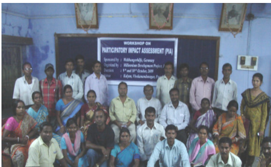
In den PIA-Workshops analysieren die Teilnehmer ihre Situation und entwickeln eigene Strategien.

Diese positiven Trends bestätigen auch die jährlichen PIA-Workshops. Beim ersten Treffen legten die Teilnehmer pro Millenniumsziel jeweils drei konkrete Entwicklungsziele für ihre Dorfgemeinschaft fest, auf die sie sich bis Ende 2010 konzentrieren wollten. Für MDG 3 (Gleichstellung der Frau) waren diese beispielsweise: 1. Sensibilisierung der Männer, 2. gleicher Lohn für Frauen und 3. Initiierung von Selbsthilfegruppen.