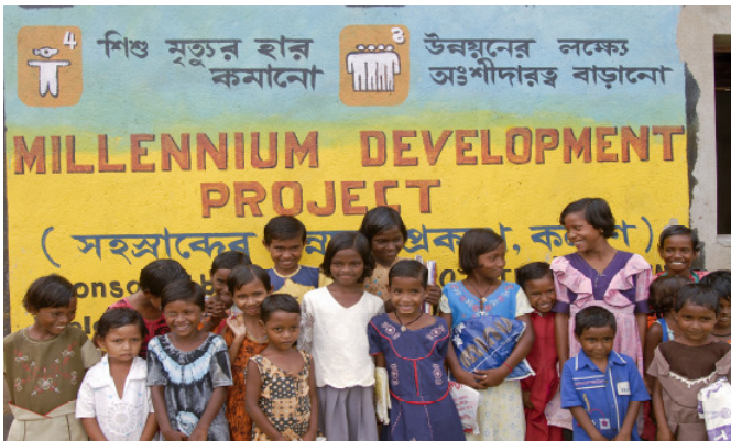
Bereits im Vorschulalter lernen die Kinder die Millenniumsziele kennen.

Wichtigste Voraussetzung für eine nachhaltige Entwicklung ist die Beteiligung der Bevölkerung. Die Welthungerhilfe versetzt die Menschen vor Ort in die Lage, sich selbst zu organisieren, die Situation im Dorf zu analysieren und realistische Lösungsansätze zu entwickeln. Dazu gehört auch die kritische Überprüfung der Aktivitäten. Im Rahmen der Millenniumsinitiative hat die Welthungerhilfe ein effektives und wirkungsorientiertes Monitoring-System entwickelt, das die Bevölkerung bewusst von Anfang an mit einbezieht.