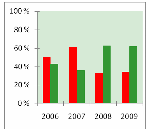
Frage 1: Kochen Sie in Ihrem Haushalt mit Pflanzenresten und Sägespänen? Antwort: Ja (in Prozent)

Große Veränderungen gab es beim Umweltschutz (MDG 7, siehe Grafik): 2006 kochte die Hälfte aller Haushalte mit Holzfeuer, drei Jahre später war es nur noch ein Drittel. Stattdessen nutzen aktuell sechs von zehn Haushalten aufbereitete und getrocknete Pflanzenreste, Dung- und Sägespänebriketts, 20 Prozent mehr als zu Beginn. Damit schützen die Bewohner ihre Wälder und sparen Kosten beim Kochen. Der Zugang zu Trinkwasser stieg im gleichen Zeitraum um 15 Prozent: Heute haben neun von zehn Befragten sauberes Wasser in ihrer Nähe. Nachdem 2006 noch jeder fünfte an Malaria erkrankt war, berichtete 2009 niemand der Befragten mehr über die Tropenkrankheit.