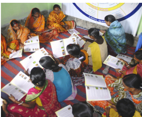
Durch Alphabetisierungskurse können die Frauen der Selbsthilfegruppen ihre Produkte erfolgreich vermarkten.

Überhaupt leben die Menschen in Gandhiji Songha heute gesünder: Durch die regelmäßige Wartung der neuen Brunnen und Kurse in Hygiene und Ernährung gibt es kaum noch Durchfallerkrankungen und Malaria. Seit der Einführung von Gesundheitsberatern sind 90 Prozent der Kinder und alle Schwangeren geimpft, junge