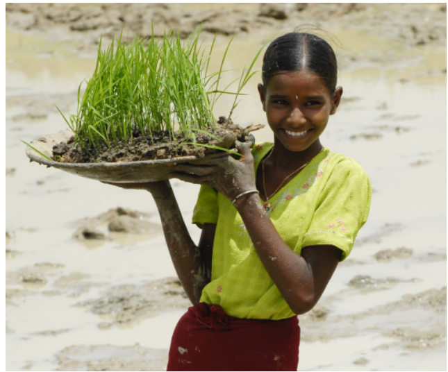
Intensivierter Reisanbau bringt höhere Erträge und benötigt weniger Wasser.

Gandhiji Songha – bestehend aus acht Weilern – liegt im indischen Bundesstaat West Bengalen etwa fünf Stunden Bahnfahrt von Kalkutta entfernt. Es ist eines der 15 Dörfer oder Regionen in Asien, Afrika und Lateinamerika, die die Welthungerhilfe im Jahr 2005 als Millenniumsdörfer ausgewählt hat. Zu Beginn der Initiative beschlossen die Bewohner jedes Dorfes, bis zum Jahr 2010 mindestens eines oder mehrere Millenniumsziele (Millennium Development Goals / MDG) aktiv umzusetzen. Die Prioritäten legten sie dabei selber fest. Fachliche und finanzielle Unterstützung nach dem Prinzip Hilfe zur Selbsthilfe erhielten die Menschen von der Welthungerhilfe. Nach fünf Jahren Projektarbeit wird jetzt Bilanz gezogen. Um die Ergebnisse in den einzelnen Millenniumsdörfern zu messen, hat die Welthungerhilfe ein umfangreiches Monitoring-System entwickelt, das nun ausgewertet worden ist.