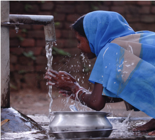
Neuer Dorfbrunnen in Gandhiji Songha.