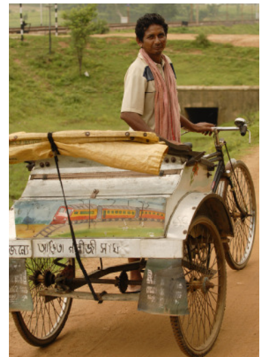
Rikschas, Fahrräder und Mopeds dienen als Transportmittel für Waren und Kranke.

Da jede fünfte Familie in Gandhiji Songha kein Land besitzt und die Mehrheit der Kleinbauern kaum vom Ertrag ihres Landes leben kann, sind zusätzliche Einkommensmöglichkeiten besonders wichtig. Deshalb hat die lokale Partnerorganisation Kalyan Ausbildungskurse für Jugendliche organisiert und Selbsthilfegruppen – allein für rund 550 Frauen - ins Leben gerufen. Sie wissen inzwischen, wie man Geflügel züchtet, Gemüse anbaut oder hochwertigen Kompost mit Hilfe von Würmern produziert. Buchhaltung und Vermarktung sind ebenfalls Thema, Lesen und Schreiben bringen sie sich gegenseitig bei. Die Welthungerhilfe und Kalyan haben den Gruppen das notwendige Startkapital verschafft. Inzwischen können sich viele Familien vom Verkauf ihrer neuen Produkte ernähren. Einige Frauen bauen sogenannte Elefantentartoffeln für den Markt an, eine nahrhafte Wurzel, die gerne gegessen wird. Andere bekamen Aufträge für das Nähen von Moskitonetzen. So werden gleich drei Zwecke erfüllt: Die Frauen haben ein eigenes Einkommen, als Unternehmerinnen steigt ihr Ansehen im Dorf und die Netze schützen vor Malaria (MDG 1, 3, 4, 5, 6).