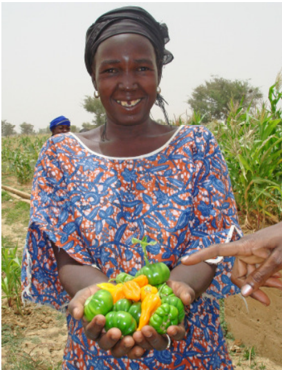
Paprika enthält Vitamine und erweitert die Produktpalette der Bauern.

Gleich zu Beginn des Projektes errichteten die Dorfbewohner drei große Becken als Wasserspeicher und zogen Gräben für die Bewässerung ihrer Felder. Die Welthungerhilfe und ihre lokale Partnerorganisation Kulima haben in den drei Dörfern Banamana, Chitalahimbera und Mangalaze trockenresistentes Saatgut verteilt. Heute erzielen die Bauern Überschüsse für den Verkauf und steigern damit ihr Familieneinkommen (MDG 1). Da sie sich nun auch in effektivem Obst- und Gemüsebau auskennen, ernähren sie sich gesünder (MDG 4, 5, 6).