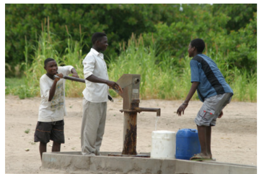
Wasser ist das kostbarste Gut in Mabote. Der Bau von Brunnen hatte oberste Priorität.

Um ihre Produkte besser zu vermarkten und Kranke schnell transportieren zu können, reparierten die Einwohner eine 13 Kilometer lange Straße zwischen Chitalahimbera und Mangalaze. Jetzt sind die Wege zu jeder Jahreszeit passierbar und Chitalahimbera entwickelt sich mit seinem im Bau befindlichen Gemeindehaus und dem Krämerladen zum lebendigen Zentrum des Millenniumsdorfes Mabote. Ab Ende 2010 soll das Gemeindehaus vielfältig genutzt werden: beispielsweise für Fortbildungen zu HIV und AIDS, zur Malariaprävention oder Landwirtschaft oder für Treffen von Gruppen und Komitees. Die Menschen von Mabote wollen die neuen Räume auch für Familienfeste wie Hochzeiten oder Beerdigungen nutzen.