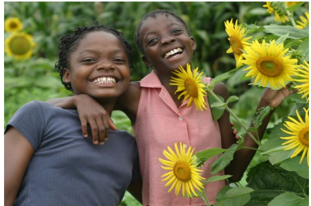
Blühende Gärten erfreuen die Mädchen, in ihnen wachsen auch vitaminreiche Gemüsesorten.

Mabote besteht aus drei Siedlungen und liegt rund 500 Kilometer nördlich der Hauptstadt Maputo. Es gehört zu einem von 15 Dörfern oder Regionen in Asien, Afrika und Lateinamerika, die die Welthungerhilfe im Jahr 2005 als Millenniumsdörfer ausgewählt hat. Zu Beginn der Initiative beschlossen die Bewohner jedes Dorfes, bis zum Jahr 2010 mindestens eines oder mehrere Millenniumsziele (Millennium Development Goals / MDG) aktiv umzusetzen. Die Prioritäten legten sie dabei selber fest. Fachliche und finanzielle Unterstützung nach dem Prinzip Hilfe zur Selbsthilfe erhielten die Menschen von der Welthungerhilfe. Nach fünf Jahren Projektarbeit wird jetzt Bilanz gezogen. Um die Ergebnisse in den einzelnen Millenniumsdörfern zu messen, hat die Welthungerhilfe ein umfangreiches Monitoring-System entwickelt, das nun ausgewertet worden ist.