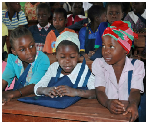
Mädchen und Jungen besuchen die neue Schule von Mabote.

Seit 2008 gibt es mehr als 50 so genannte Modellfamilien mit Kindern unter fünf Jahren. Die Mütter werden in Hygiene, Ernährung und Gesundheit ausgebildet und sie lernen, wie man Obst und Gemüse anbaut. In den Kursen geht es um einfache, aber effektive Maßnahmen: Geschirrständer schützen vor herumlaufenden Tieren, Latrinen und Abfallgruben halten Insekten fern, die Teilnehmer waschen sich vor dem Essen die Hände und schlafen unter Moskitonetzen. Und sie erfahren wichtige Grundlagen der Säuglings- und Krankenpflege (MDG 4, 5, 6). Ihr neues Wissen geben diese Familien weiter. Ein weiterer Schwerpunkt im Millenniumsdorf ist das Thema HIV: Ausgebildete AIDS-Beraterinnen sprechen mit den Menschen über die Gefahren und Infektionswege des HI-Virus, Theaterstücke verdeutlichen die Problematik. Andere Aufklärungskampagnen sensibilisieren die Bevölkerung für die Folgen von Brandrodung, Abholzung und Holzkohleproduktion (MDG 6, 7).