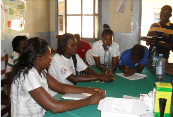
Fortbildungen und PIA-Workshops stärken die Selbsthilfekräfte der Bevölkerung.

Wichtigste Voraussetzung für eine nachhaltige Entwicklung ist die Beteiligung der Bevölkerung. Die Welthungerhilfe versetzt die Menschen vor Ort in die Lage, sich selbst zu organisieren, die Situation im Dorf zu analysieren und realistische Lösungsansätze zu entwickeln. Dazu gehört auch die kritische Überprüfung der Aktivitäten. Im Rahmen der Millenniumsinitiative hat die Welthungerhilfe ein effektives und wirkungsorientiertes Monitoring-System entwickelt, das die Bevölkerung bewusst von Anfang an mit einbezieht.