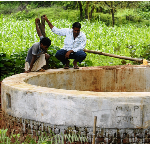
Brunnenbau in einem Weiler Sarwans.