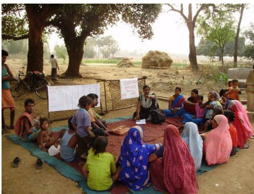
Männer und Frauen sind bei den PIA-Workshops und Dorfversammlungen gleichermaßen vertreten.

Diesen positiven Trend bestätigen auch die jährlichen PIA-Workshops. Beim ersten Treffen legten die Teilnehmer pro Millenniumsziel jeweils drei konkrete Entwicklungsziele für ihre Dorfgemeinschaft fest, auf die sie sich bis Ende 2010 konzentrieren wollten. Für MDG 3 (Geschlechtergerechtigkeit) waren dies beispielsweise: 1. Mädchen und Jungen sollen gleichermaßen die Schule besuchen, 2. die Arbeitsbelastung für Männer und Frauen soll gerecht verteilt sein und 3. Frauen sollen in den Dorfversammlungen stärker vertreten sein und an wichtigen Entscheidungen teilnehmen.