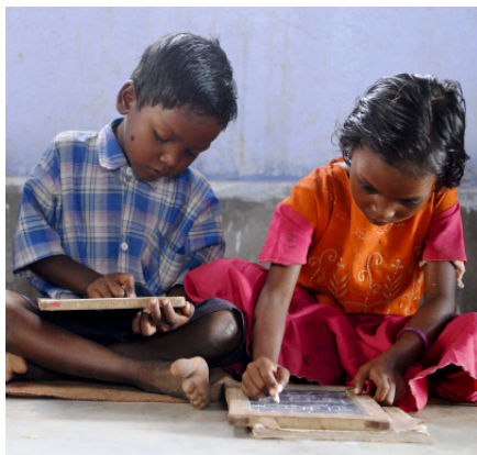
Hochkonzentrierte Vorschüler in Sarwan.

Die Kleinbauern brauchen jedoch auch Alternativen zum Erwerb ihres Lebensunterhalts. Deshalb fördern die Welthungerhilfe und ihre lokalen Partnerorganisationen Center for World Solidarity (CWS) und Pravah zahlreiche Selbsthilfegruppen. Allein die Frauen haben 50 Gruppen gegründet. Sie erhalten Zugang zu staatlichen Spar- und Kreditprogrammen und stellen Kompost her, züchten Kleintiere oder Milchvieh, produzieren Seile aus Jute oder töpfern Einwegbecher und -schalen. Der Erfolg als Unternehmerinnen stärkt die Position der Frauen. Ihr Einkommen ermöglicht den Männern, sich seltener als Wanderarbeiter zu verdingen zu müssen. Außerdem lernen die Frauen in den Selbsthilfegruppen das Wichtigste über Ernährung, Hygiene und Gesundheit. So sind Sarwans Frauen heute selbstbewusste Mitglieder der Dorfgemeinschaft, die ihre Kinder – Jungen wie Mädchen – impfen lassen und zur Schule schicken (MDG 1, 2, 3, 4, 5).