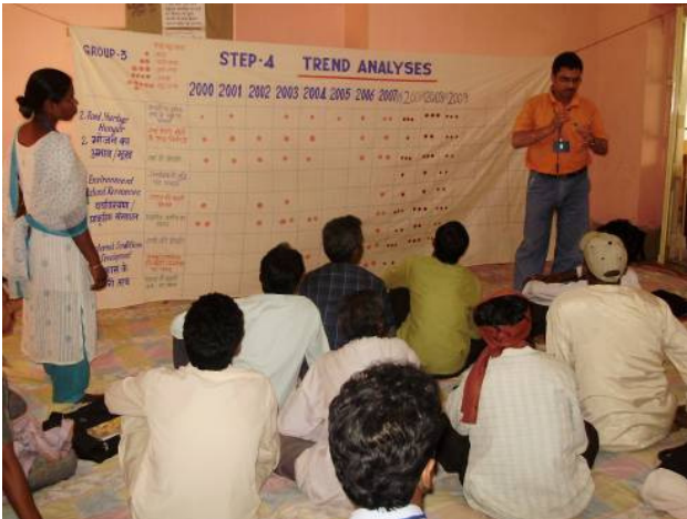
Beim PIA-Workshop wenden die Teilnehmer die Millenniumsziele auf ihre Situation vor Ort an.

Wichtigste Voraussetzung für eine nachhaltige Entwicklung ist die Beteiligung der Bevölkerung. Die Welthungerhilfe versetzt die Menschen vor Ort in die Lage, sich selbst zu organisieren, die Situation im Dorf zu analysieren und realistische Lösungsansätze zu entwickeln. Dazu gehört auch die kritische Überprüfung der Aktivitäten. Im Rahmen der Millenniumsinitiative hat die Welthungerhilfe ein effektives und wirkungsorientiertes Monitoring-System entwickelt, das die Bevölkerung bewusst von Anfang an mit einbezieht.