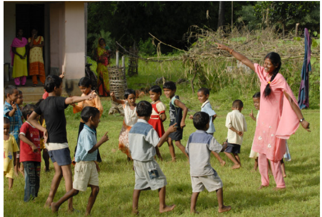
Bildung kann nicht früh genug beginnen. In Sarwan gehen die Kinder jetzt in die Vorschule.

Sarwan besteht aus 26 Weilern und liegt im indischen Bundesstaat Jharkhand (früher Süd-Bihar). Es gehört zu einem von 15 Dörfern oder Regionen in Asien, Afrika und Lateinamerika, die die Welthungerhilfe im Jahr 2005 als Millenniumsdörfer ausgewählt hat. Zu Beginn der Initiative beschlossen die Bewohner jedes Dorfes, bis zum Jahr 2010 mindestens eines oder mehrere Millenniumsziele (Millennium Development Goals / MDG) aktiv umzusetzen. Die Prioritäten legten sie dabei selber fest. Fachliche und finanzielle Unterstützung nach dem Prinzip Hilfe zur Selbsthilfe erhielten die Menschen von der Welthungerhilfe. Nach fünf Jahren Projektarbeit wird jetzt Bilanz gezogen. Um die Ergebnisse in den einzelnen Millenniumsdörfern zu messen, hat die Welthungerhilfe ein umfangreiches Monitoring-System entwickelt, das nun ausgewertet wurde.