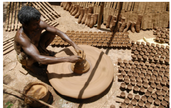
Töpferei und anderes Handwerk bietet den Menschen alternative Einkommensmöglichkeiten.

Das notwendige Wissen haben die Männer und Frauen in Kursen zu nachhaltiger Landwirtschaft erworben. Jetzt wenden