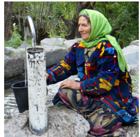
Durch Trinkwasserzapfstellen gibt es weniger Fälle von Typhus oder Durchfall.

Um ihre Zukunft aktiv gestalten zu können, haben die Männer und Frauen von Veshab ein Dorfentwicklungskomitee und verschiedene Initiativgruppen gegründet. Einige Gruppen halten Kaschmir-Ziegen und produzieren Wolle und Käse, andere flechten Naturkörbe. Mädchen haben schneiden gelernt und nähen nun Kleidung für die Dorfbewohner. Eine Gruppe kümmert sich um die Wartung des neuen Trinkwassersystems, eine weitere entwickelt ein nachhaltiges Tourismuskonzept. Da Veshab in der Nähe der Seidenstraße liegt, ein muslimisches Heiligtum und eine attraktive Bergwelt besitzt, hat die Idee gute Aussichten auf Erfolg (MDG 1, 7)