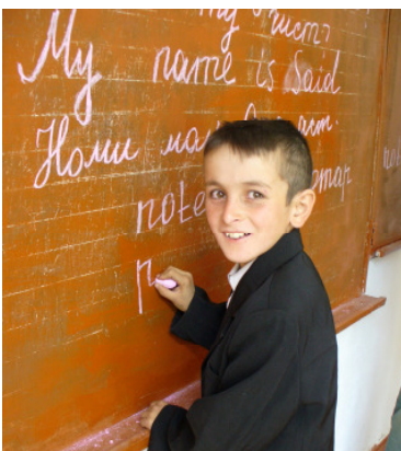
Die Dorfschule ist nach dem Umbau auch im Winter nutzbar.

Frauen haben sich zusammengeschlossen, um ihr Selbstbewusstsein und ihre Position innerhalb der Gemeinschaft zu stärken. Bei den Treffen der Welthungerhilfe lernen sie ihre Rechte kennen, sie sprechen über Gesundheit, Hygiene und Ernährung oder kochen gemeinsam Obst ein (MDG 1, 3). Das Dorfleben ist so aktiv geworden, dass die Menschen einen neuen Ortsteil gegründet haben: In Dashti Soyaru entstehen Steinhäuser mit fortschrittlichen Küchengärten und einem weitreichenden Trinkwassersystem, das von einer Quelle oberhalb des Dorfes gespeist wird. Durch das saubere Trinkwasser sind Krankheiten deutlich zurückgegangen (MDG 4, 5, 6). Inzwischen gibt es auch erste energiesparende Öfen in Veshab, mit denen der Holzverbrauch zurückgeht. Das schützt die Umwelt und die Atemwege. Trotzdem muss noch viel getan werden, um die Armut zu überwinden. Die Dorfbewohner blicken jedoch zuversichtlicher in die Zukunft.