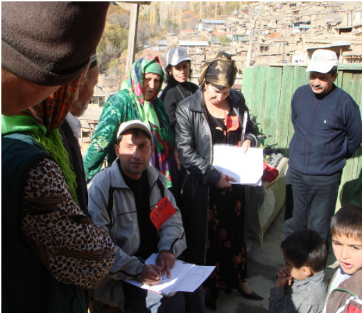
Die jährlichen Haushaltsbefragungen dokumentieren die Entwicklungen.

Wichtigste Voraussetzung für eine nachhaltige Entwicklung ist die Beteiligung der Bevölkerung. Die Welthungerhilfe versetzt die Menschen vor Ort in die Lage, sich selbst zu organisieren, die Situation im Dorf zu analysieren und realistische Lösungsansätze zu entwickeln. Dazu gehört auch die kritische Überprüfung der Aktivitäten. Im Rahmen der Millenniumsinitiative hat die Welthungerhilfe ein effektives und wirkungsorientiertes Monitoring-System entwickelt, das die Bevölkerung bewusst von Anfang an mit einbezieht.