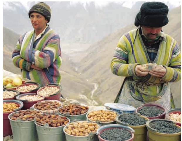
Trockenobst ist eine neue Einkommensquelle für die Menschen in Veshab.

Veshab ist ein Hochgebirgsdorf im unwirtlichen Norden Tadschikistans. Es gehört zu einem von 15 Dörfern oder Regionen in Asien, Afrika und Lateinamerika, die die Welthungerhilfe im Jahr 2005 als Millenniumsdörfer ausgewählt hat. Zu Beginn der Initiative beschlossen die Bewohner jedes Dorfes, bis zum Jahr 2010 mindestens eines oder mehrere Millenniumsziele (Millennium Development Goals / MDG) aktiv umzusetzen. Die Prioritäten legten sie dabei selber fest. Fachliche und finanzielle Unterstützung nach dem Prinzip Hilfe zur Selbsthilfe erhielten die Menschen von der Welthungerhilfe. Nach fünf Jahren Projektarbeit wird jetzt Bilanz gezogen. Um die Ergebnisse in den einzelnen Millenniumsdörfern zu messen, hat die Welthungerhilfe ein umfangreiches Monitoring-System entwickelt, das nun ausgewertet worden ist.