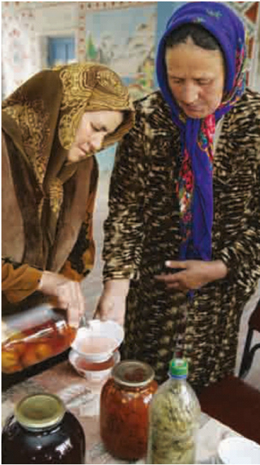
Einkochen für den langen Winter.

Das Leben in Veshab ist etwas leichter geworden. Die Einkommen sind gestiegen und heute gibt es im Millenniumsdorf einen Fleischer, einen Tante-Emma-Laden, eine Apotheke und einen gut funktionierenden Gesundheitsposten. Durch den Bau einer Pipeline haben alle Dorfbewohner Zugang zu sauberem Trinkwasser. Die Schule ist renoviert und erhielt ein neues Toilettenhäuschen mit Waschbecken. Viele Familien haben sich ein Auto gekauft, mit dem sie in die nächste Stadt Ayni fahren können, die in 47 Kilometer Entfernung an der M 34 zur Hauptstadt Duschanbe liegt. Damit haben sie sich einen Zugang zu den Märkten Tadschikistans geschaffen, auf denen sie ihre neuen Produkte verkaufen können (MDG 1).