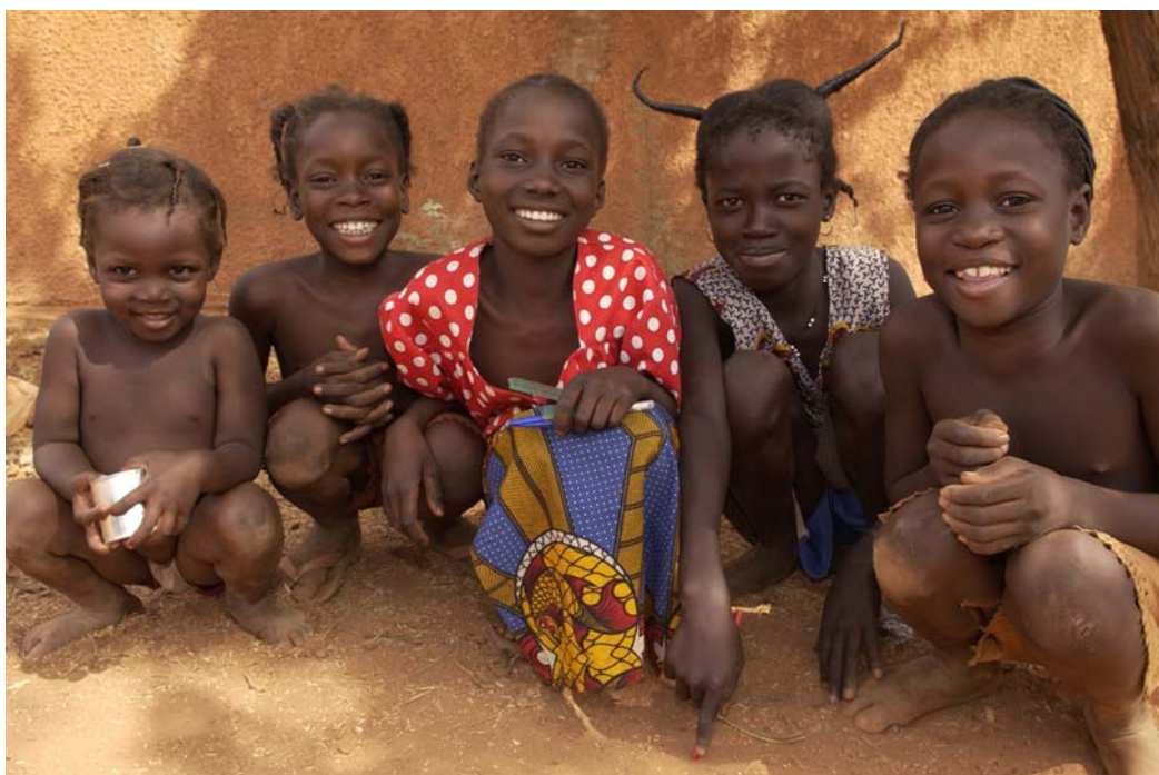
Für eine bessere Zukunft: Kinder aus Kongoussi