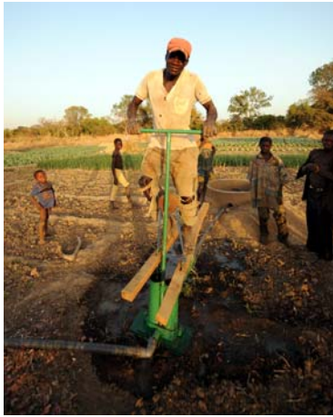
Hilfe tut not: Feldarbeit in Burkina Faso

„Wir werden so lange demonstrieren, bis sich was geändert hat“, betonten kürzlich die Gewerkschaftsverbände in Burkina Faso. Sie hatten bereits Anfang April zu Protesten aufgerufen, gegen gestiegene Lebenshaltungskosten und die nach wie vor niedrigen Löhne.