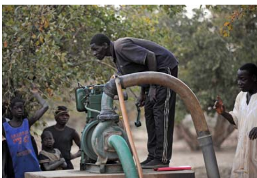
Pumpstation zur Bewässerung der Gemüseärten in Tangaye