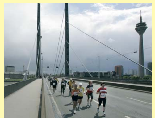
Sport baut Brücken: Welthungerhilfe-Team am Start

Mit einem Staffel-Team startet die Welthungerhilfe beim Düsseldorfer Marathon am 4. Mai und zeigt Flagge für die diesjährige Städtepartnerschaft. Ausgestattet mit extra angefertigten Laufshirts gehen die Läufer auf die Strecke und legen dabei zwischen 8,5 und 12 Kilometern zurück. Als „Staffelstab“ dient ein Klettband mit Zeitnahme-Chip, das am Fußgelenk befestigt wird.