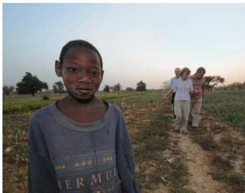
Besichtigung von Maßnahmen zum Erosionsschutz und zur Anlage eines Gemüsegartens in Tangaye