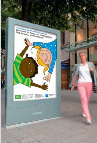
Auffallend im Stadtbild: Citylights an markanten Stellen.