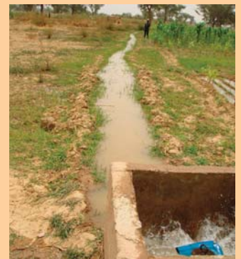
Die Pumpe vom See ermöglicht endlich mehrere Gemüseernten im Jahr.