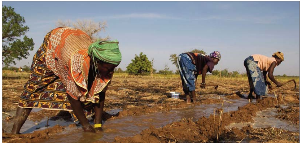
Die Verbesserung der Agrartechniken und die Ertragssteigerung sind der einzige Weg aus der Nahrungsmittelkrise. Ein erster Schritt ist das neue Bewässerungssystem für die Felder in Kongoussi, Burkina Faso.