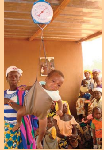
Einmal im Monat wird der Gesundheitszustand der kleinen Kinder geprüft. Sie werden gewogen und untersucht.

„Es war ein großartiges Erlebnis, alle mir bislang nur in der Theorie bekannten Projektinhalte nun buchstäblich anfassen zu dürfen. Diese persönliche Erfahrung hilft mir sehr, noch intensiver und authentischer als vorher für die Partnerschaft in Düsseldorf werben zu können“, berichtete sie von ihren Erlebnissen. Der Partner der Welthungerhilfe in Kongoussi, die Organisation Zood Nooma, verfolgt mit verschiedenen Maßnahmen das Ziel, Hunger und Armut dauerhaft zu bekämpfen und allen Kindern eine Grundschulbildung zu ermöglichen. Machen Sie sich selbst ein Bild von den Bausteinen des Projektes, die zeigen: Die Zukunft hat schon begonnen!