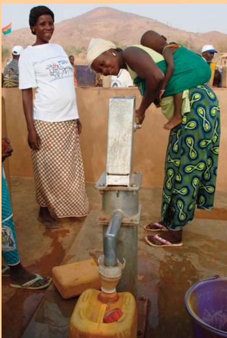
Neue Brunnen, wie hier in Boalin, spenden sauberes Trinkwasser und verkürzen die Wasserwege.