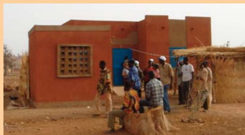
Die Lehrerwohnungen sind ein wichtiger Pluspunkt für die Lehrer, um sich in den Dörfern niederzulassen.