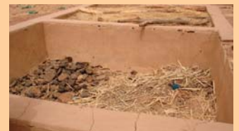
In den letzten zehn Jahren wurden bereits 400 dieser sehr effektiven Kompostgruben in der ganzen Region gebaut.