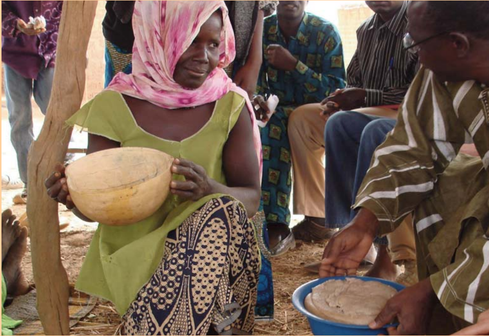
In Trockenzeiten ist nicht genug zu essen da: Eine Frau zeigt Zood-Nooma-Präsident Oscar Sawadogo eine Tagesration Tô (Hirsebrei) für die ganze Familie.