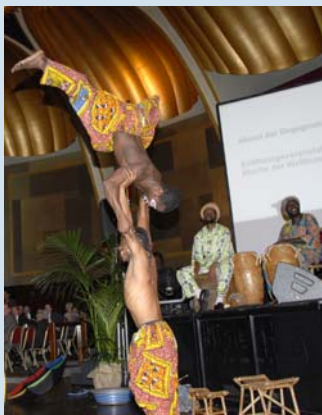
Die Gruppe Adesa aus Ghana zeigt exotische Akrobatik-Kunststücke.

Und auf die Partnerschaft bezogen: „Ohne das bürgerschaftliche Engagement können Organisationen wie die Welthungerhilfe nicht erfolgreich sein. Ohne Sie können wir ein solches Partnerschaftsjahr nicht gestalten und die Menschen in der Sahelzone unterstützen.“