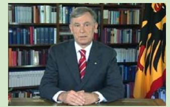
Bundespräsident Horst Köhler, Schirmherr der Welthungerhilfe