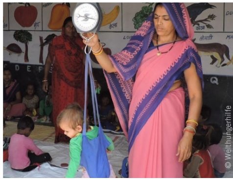
Herkömmliche Wiegemethode in Indien