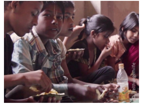
Ziel: Eine verbesserte Ernährung von Kindern