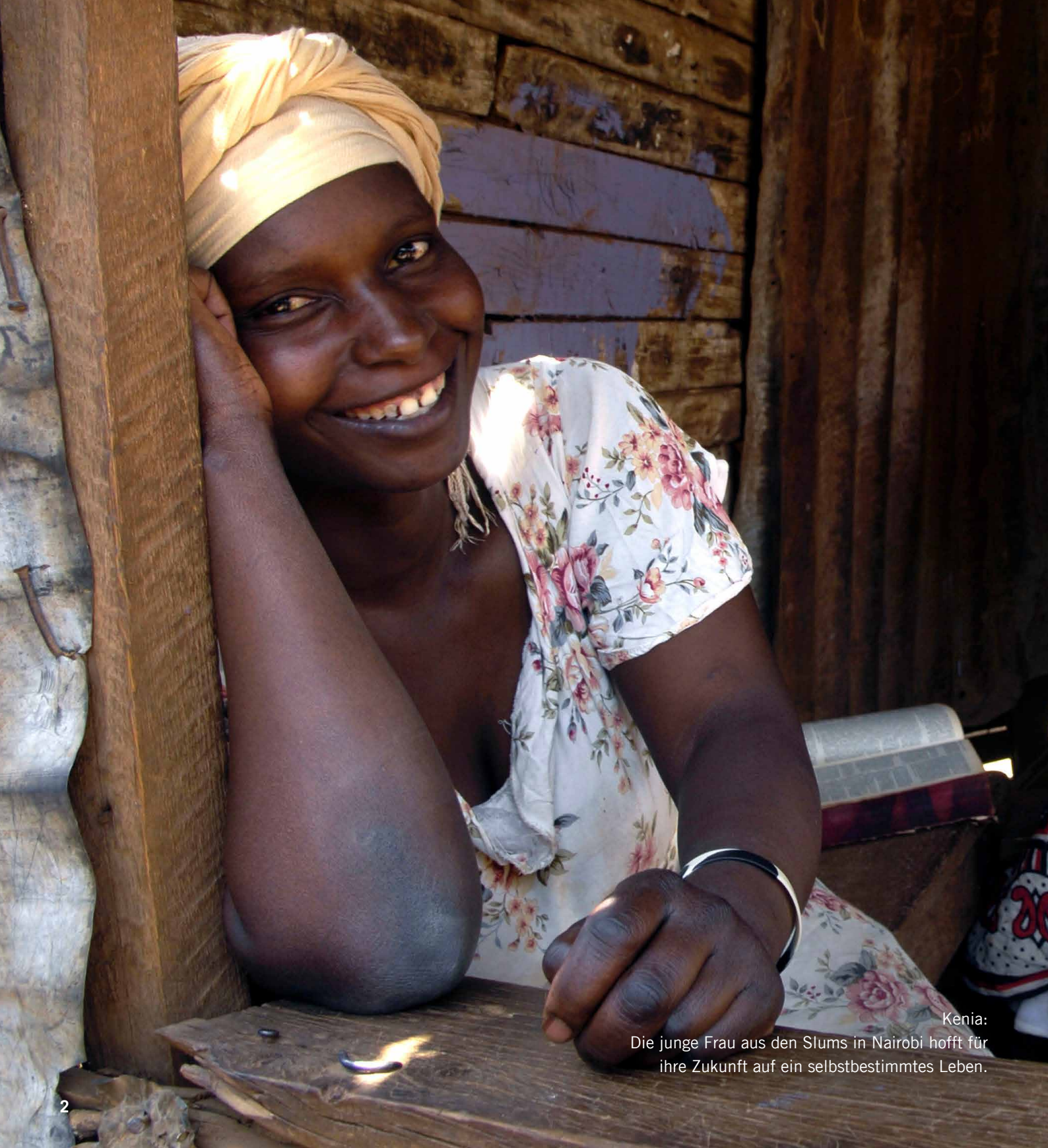
Kenia: Die junge Frau aus den Slums in Nairobi hofft für ihre Zukunft auf ein selbstbestimmtes Leben.