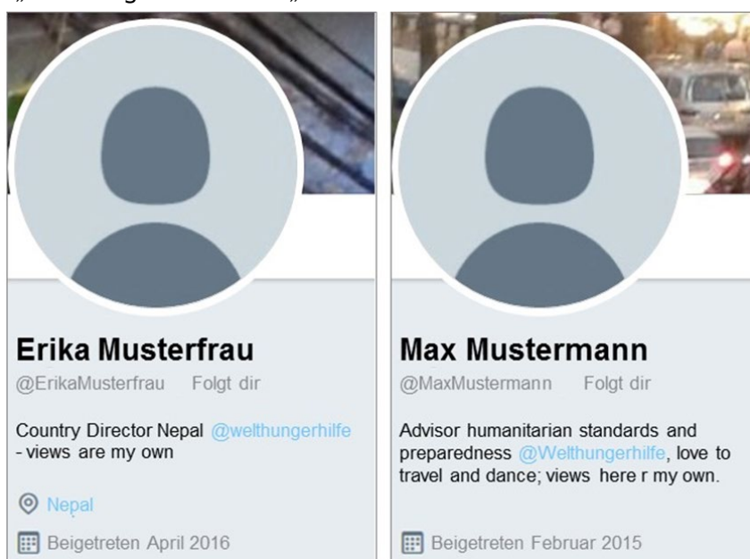
Beispiele für Social-Media-Profile von Welthungerhilfe Mitarbeitenden

Die Nutzung von offiziellen Logos, z.B. das Welthungerhilfe-Logo oder Kampagnen-Logos wie „Reiten gegen den Hunger“, auf privaten Konten (als Profilbild oder Hintergrundbild) ist nicht gestattet. Ein Bild, auf dem Du ein T-Shirt mit Logo trägst, ist aber in Ordnung. Benutze nicht „Welthungerhilfe“ oder „WHH“ als Teil Deines Profilnamens.